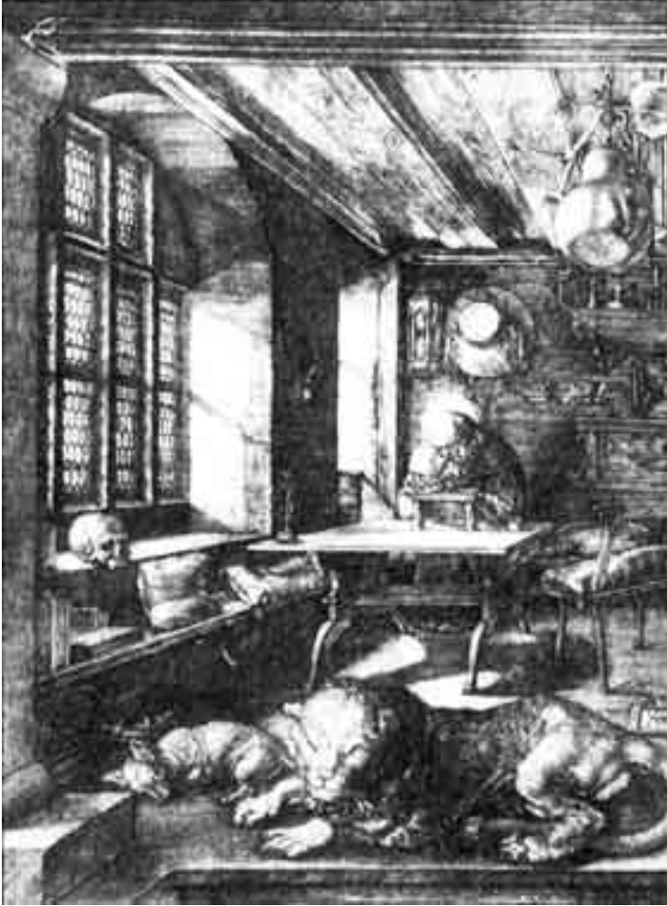
لوحة 2 ألبرت ديرر، القديس جيروم في مكتبته، حضر 1514، جامعة جلاسجو، قاعة هانتريان للفن